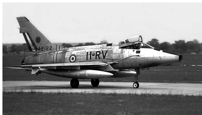
事故機と同型のF-100D型戦闘機