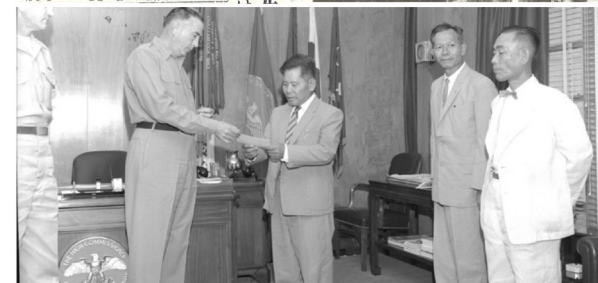
「石川の小学校に小切手を贈る高等弁務官」(39-31-4)